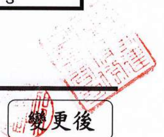
【圖 17-1】權利變換後更新單元地籍套繪圖